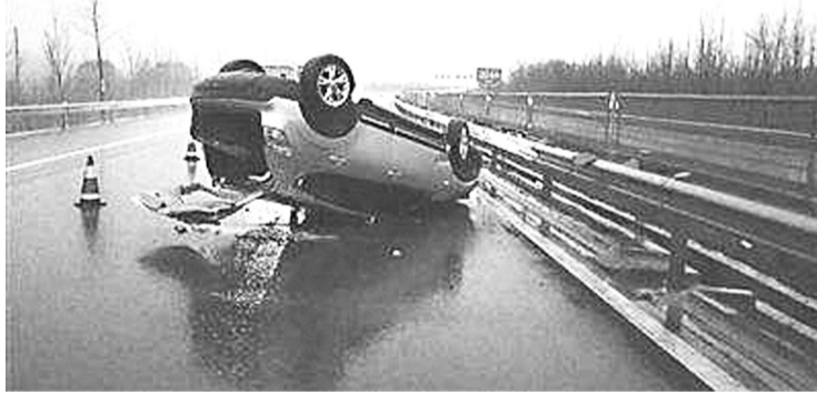
霍某某驾驶越野车冲撞王某某等人乘坐的捷达车,导致越野车失控翻车。

保险诈骗罪,是指以非法获取保险金为目的,违反保险法规,采用虚构保险标的、保险事故或者制造保险事故等方